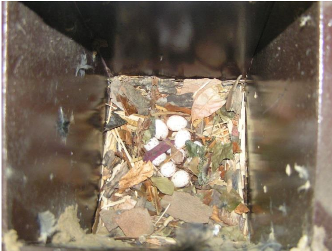
De eieren, 12 stuks!

invlieggat naar binnen zou kunnen kijken. Dit lukte, de aanblik gaf de burger moed, nestmateriaal lag in het nest, verzamelde boomschors en bladeren. Op een bepaald ogenblik kon de vlag uit, de vooruitzichten op een babyborrel werden zekerder, er lagen eieren in het nest. Ze kwamen echter niet uit. Ik moest toch maar eens de klep los maken. Hier kreeg ik