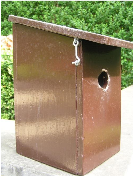
één van de geproduceerde nestkasten

Dan studeren, alles te weten komen over voeding, gewoontes, kweek, nestkasten enz.