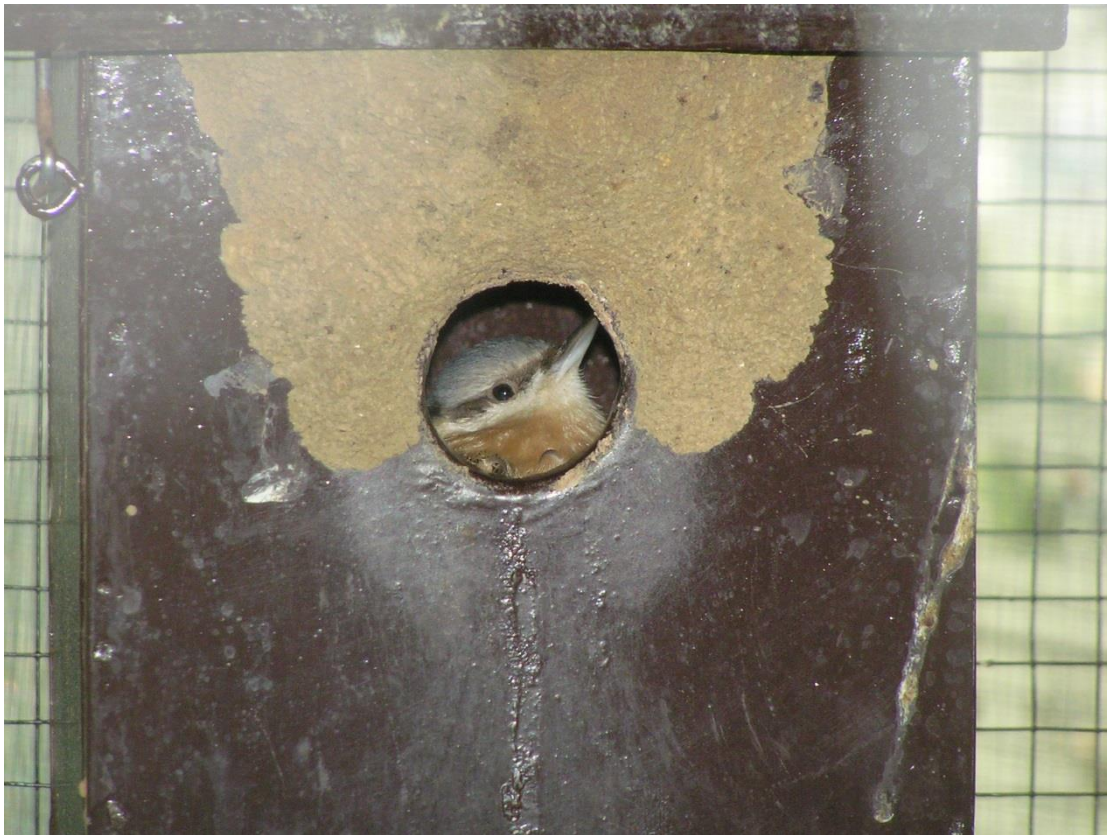
Zie er maar eens in te komen! ..... de knipoog ontbreekt nog.

Blijkbaar hoorde de dans tot het geheel van rituelen behorende bij de ingebruikname van de woning.